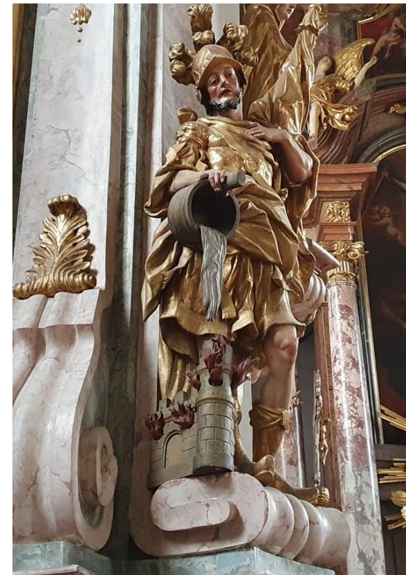
St. Florian, Pfarrkirche Gnigl, linker Seitenaltar Sein Gedenktag ist am 04.Mai

Informationen aus der Pfarre Gnigl 21.04. – 05.05.2024