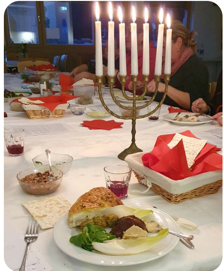
Text & Bild: Hans Fackler

Wer mitfeiern möchte kann sich gerne bis Freitag, den 22. März im Pfarrbüro anmelden.