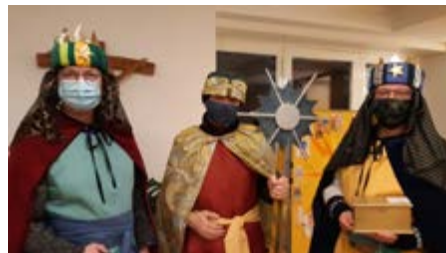
Text & Fotos: Jungschar Gnigl